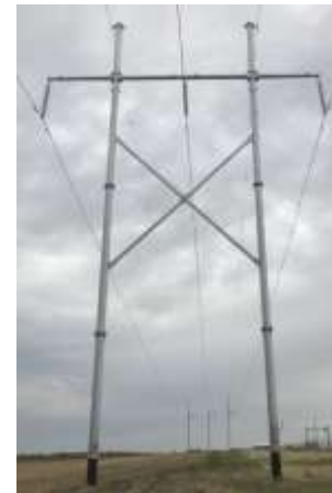
Pour la ligne de transmission 715BL proposée, les structures monopoles ressembleront à la photo de gauche, et les structures en H ressembleront à la photo de droite.

Des structures spécialisées peuvent être nécessaires à certains endroits sur chaque itinéraire en fonction des exigences d'ingénierie. Ces structures peuvent être plus hautes que les hauteurs indiquées ci-dessus et seront discutées avec les parties prenantes concernées.